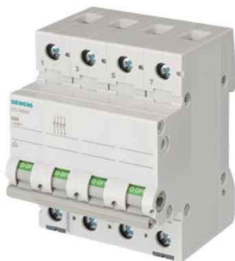
Interrupteur d'arrêt 100A 4 pôles