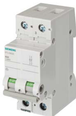
Interrupteur d'arrêt 40A 2 points